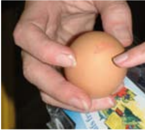
Eieren (p. 6)