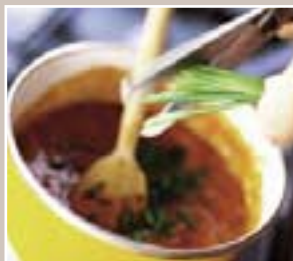
In de keuken (bladzijde 5)